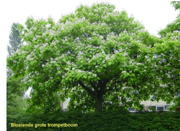
Bloeiende grote trompetboom

De grote trompetboom ofwel Katalpa ( Catalpa bignoides ). We schreven er al eerder over. Een herhaling waard nu ze zo prachtig bloeien. Je vindt er vier, niet al te hoog, in het midden-plantsoen van de Mr. van Houtenweg. Ze hebben grote, hartvormige bladeren en pluimen met grote trompetvormige (vandaar de naam) witte bloemen. Daarna vormen zich lange (18-35 cm) doosvruchten (lange bruine sperziebonen) met, als de vruchten open barsten platte harige zaden.