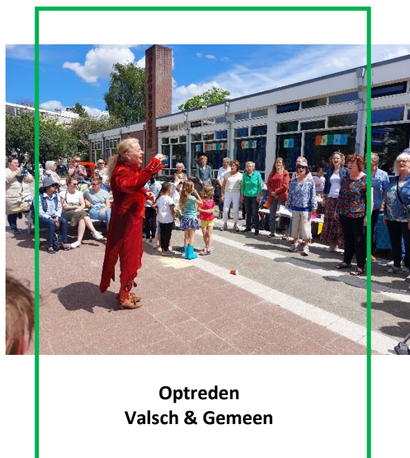
Optreden Valsch & Gemeen