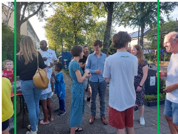
Een supergezellige buurtborrel bij de containertuintjes