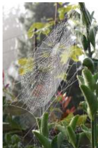
Herfst in de tuin