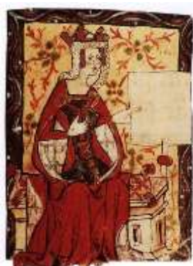
Keizerin Mathilde 1122 (Online Museum De Bilt)

Vertrek 15.00 uur vanaf het Gezondheidscentrum, Henrica van Erpweg, verzamelen vanaf 14.45 uur.