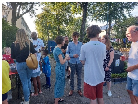
Reden voor een feestje