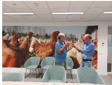
Met klein feestje.....