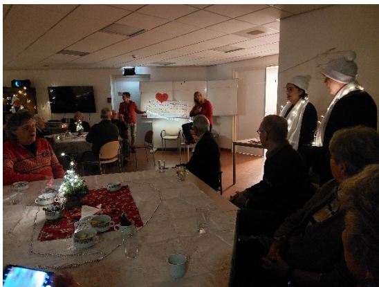
Buurt en kennismakingsborrel