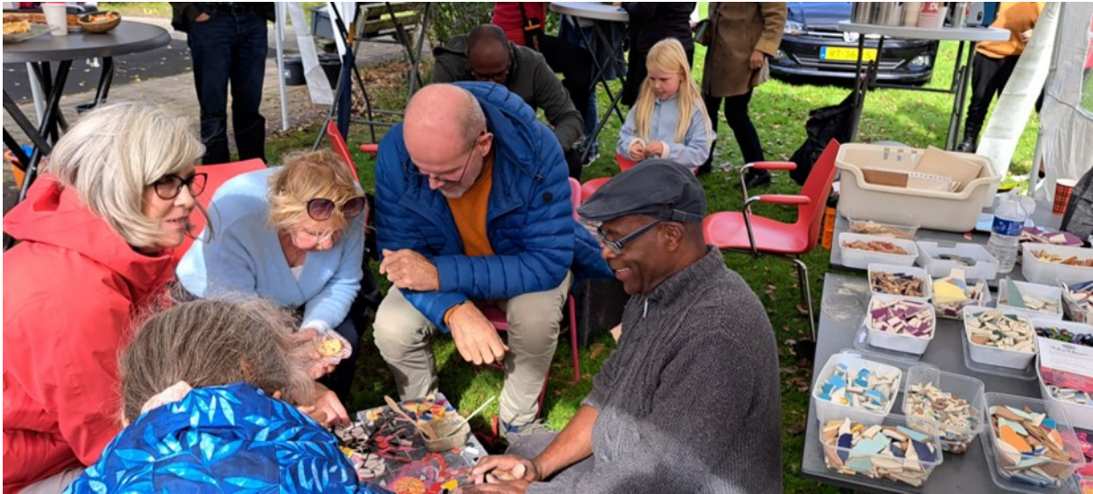
Samen ontmoetingsbankjes mozaïeken

Opnieuw is er het afgelopen jaar in onze wijk van alles en nog wat ontstaan dat er voorheen niet was. Simpelweg omdat de meeste buurtgenoten er graag iets moois van maken en dat met elkaar toch een stuk leuker en inspirerender is dan in je dooie eentje.