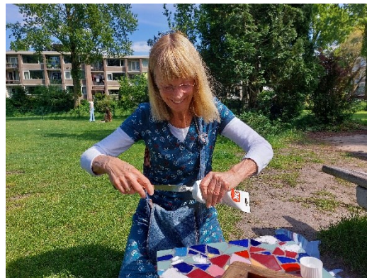
Al moeten er soms een hersteld