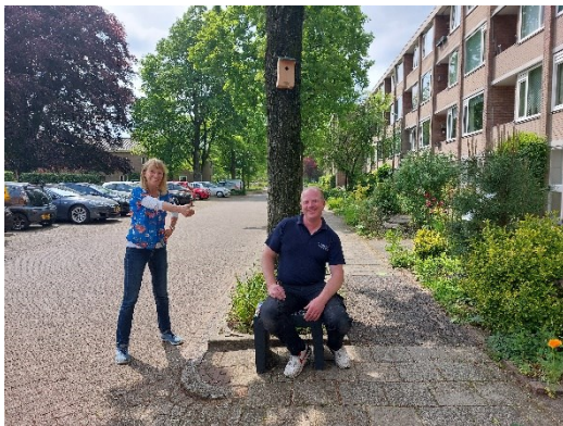
Weer een bankje op de plek