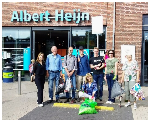
Struinen in het struweel met koffie na.....